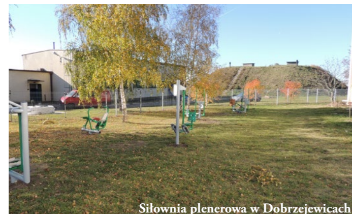
Siłownia plenerowa w Dobrzejewicach