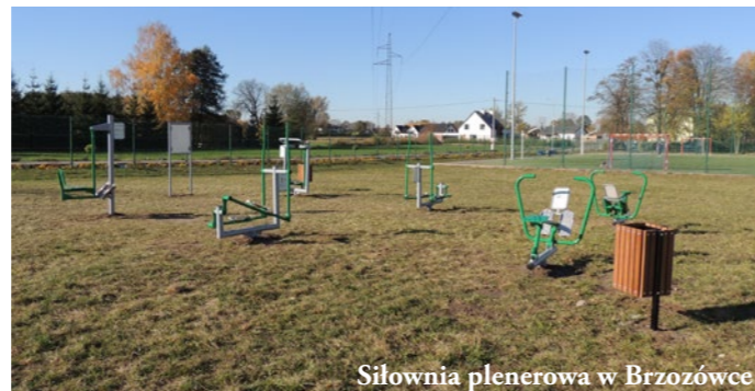
Siłownia plenerowa w Brzozówce