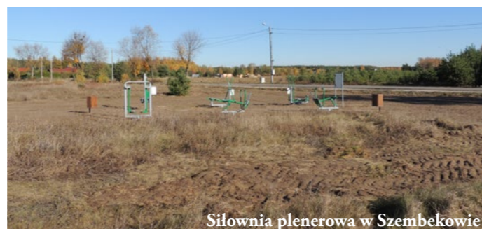
Siłownia plenerowa w Szembekowie