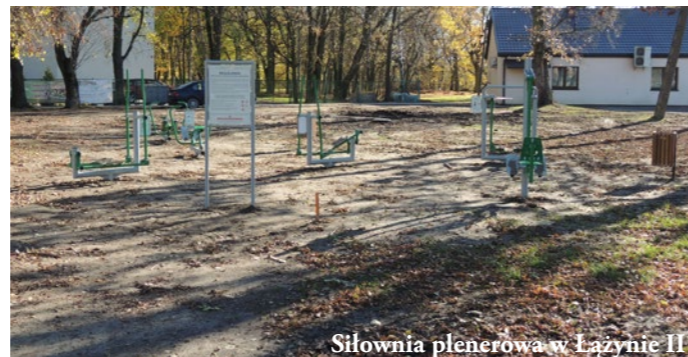
Siłownia plenerowa w Łązynie II