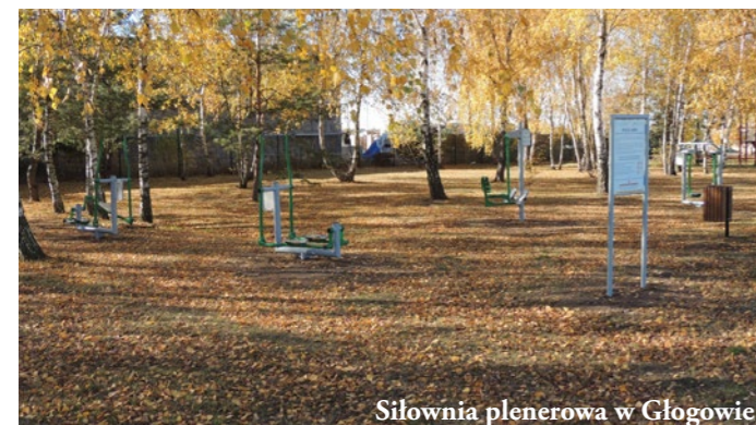
Siłownia plenerowa w Głogowie