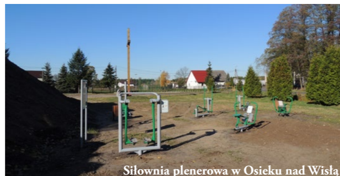
Siłownia plenerowa w Osieku nad Wisłą