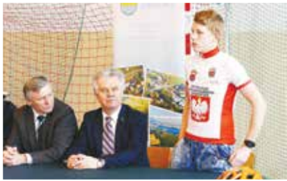
Uroczysta inauguracja działalności UKS Kometa Obrowo str. 4