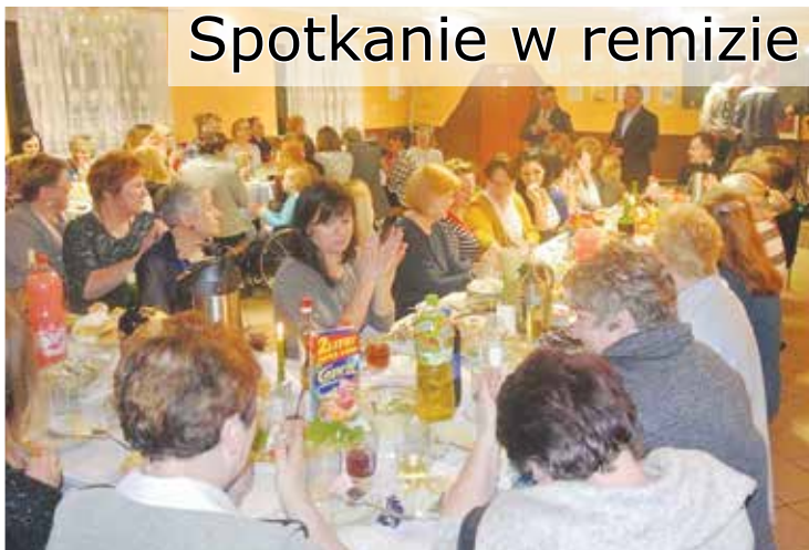
Spotkanie w remizie