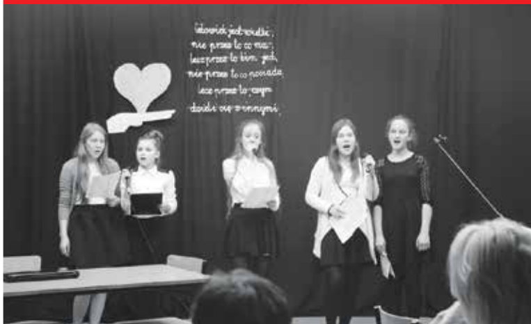
Impreza charytatywna - luty 2016 r.

W drugiej połowie lutego br. Samorząd Uczniowski zorganizował na terenie szkoły imprezę charytatywną na rzecz najbardziej potrzebujących uczniów w naszej szkole. Impreza była podzielona na dwie części. W pierwszej zaprezentowali się członkowie grypy teatralnej „Talia Absolwencji” z zaprzyjaźnionej gminy Chrostkovo, a w drugiej wystąpili uczniowie z Zespołu Szkół im. Jana Pawła II w Obrowie, umilając czas gościom swoimi popisami wokalnymi. Najlicniejszą grupą odbiorców byli członkowie Klubu Seniora „Sami Swoi”, którzy już od kilku lat przyjaźnią się ze szkołą i jej społecznością. Kwota jaką udało się zebrać to 580 zł.