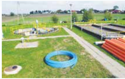
Nowe inwestycje w gminie - kolektory i wodociągi str. 6