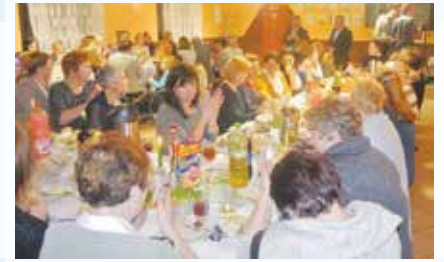
Relacja ze spotkań z okazji Dnia Kobiet str. 12