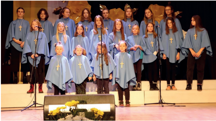
Nasza osiecka Schola

Członkowie Osieckiego Klubu Kultury, podlegającego pod Gminny Ośrodek Kultury w Obrowie, zdobywają kolejne laury.