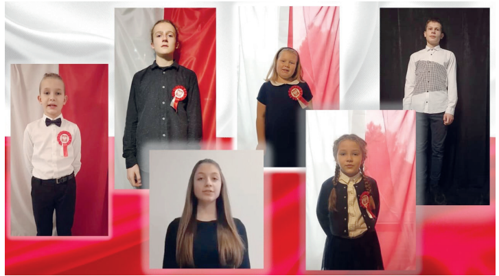
Laureaci konkursu recytatorskiego CSAiU w Toruniu

W II Garnizonowym Konkursie Recytatorskim z okazji Święta Niepodległości zorganizowanym przez Centrum Szkolenia