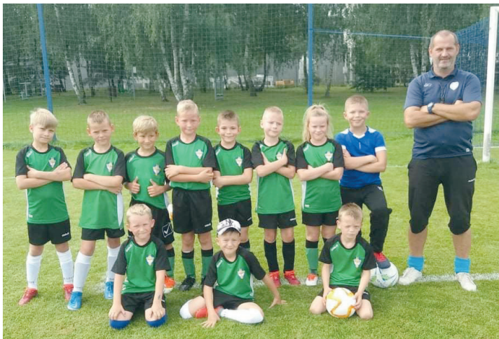
1. W pierwszym meczu sezonu seniorzy Orła Głogowo pokonali LZS Steklin 6:0. 2. Grupa żaków Orła Głogowo, fot. archiwum Marcina Białka, trenera.

Seniorska drużyna Orła Głogowo zdecydowanie lepiej radziła sobie na początku sezonu niż w drugiej jego części. Do 31 października zanotowali 6 zwycięstw, 3 remisy i 1 porażkę. Na ogół wygrywali przekonująco, różnicą od 2 do 6 bramek. Końcówka rundy jesiennej to już niestety 0:4 z Piastem Łasin i blamaż 0:8 z Ogniem Zygartowice. Takie wyniki dają 7. miejsce w tabeli. Mamy nadzieję, że zimny prysnąć poskutkuje zwykłą formą na wiosnę. Kolejne spotkanie nasze Orły ro-