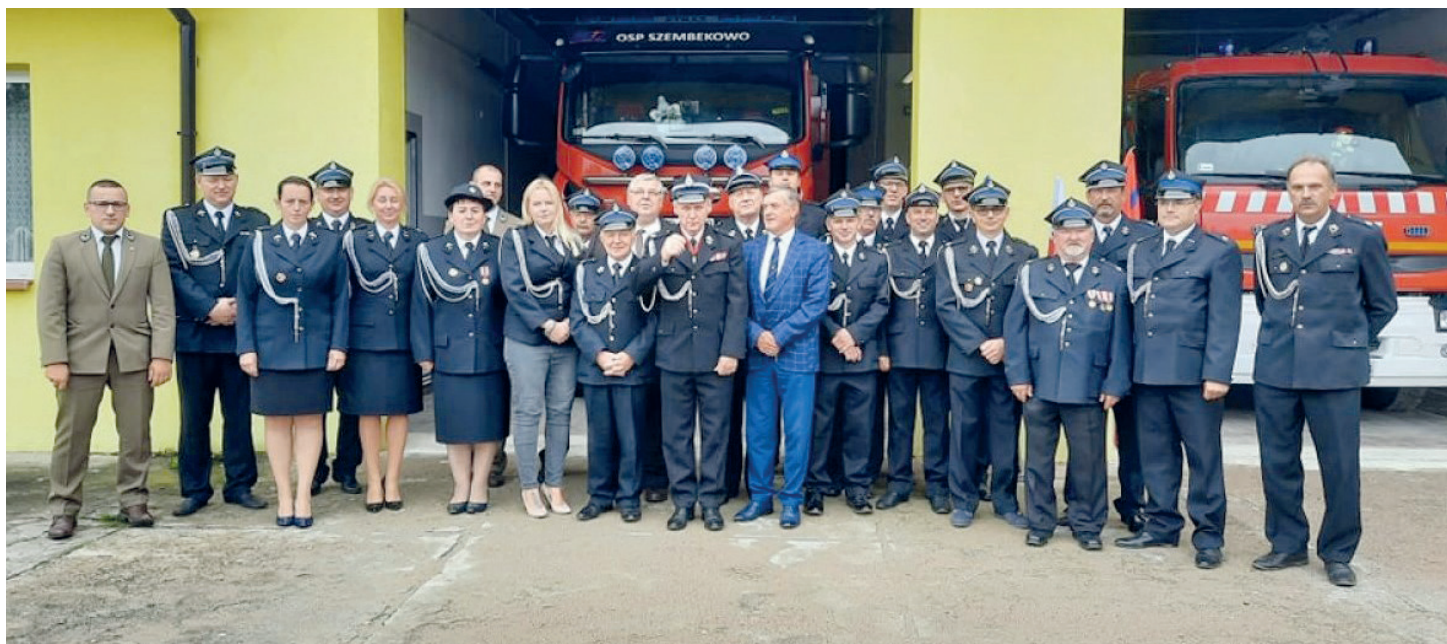
Strażacy obecni na zjeździe OSP z terenu gminy Obrowo

1629 wyjazdów w ciągu pięciu lat - tyle mówią statystyki o działaniach naszych OSP. W praktyce oznacza to 27 interwencji w miesiąc, czyli niemalże jedną dziennie!